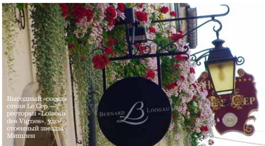
Выгодный «сосед» отеля Le Cep — ресторан «Loiseau des Vignes», удостоенный звезды Мишлен