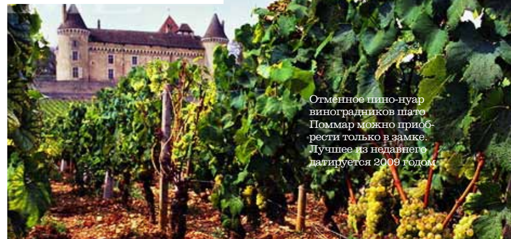
Отменное пино-нуар виноградников шато Поммар можно приобрести только в замке. Лучшее из недавнего датируется 2009 годом

Что и говорить, приятно вернуться из путешествия с полным чемоданом впечатлений и, собрав гостей, угощать их дорожными байками и феерическим пино-нуар. Но еще приятнее планировать новый тур на бургундские земли, мечтая как следует распробовать их на вкус. Хорошее вино стоит того, чтобы его навестили — аксиома для всех, кто имел честь с таким познакомиться. ●