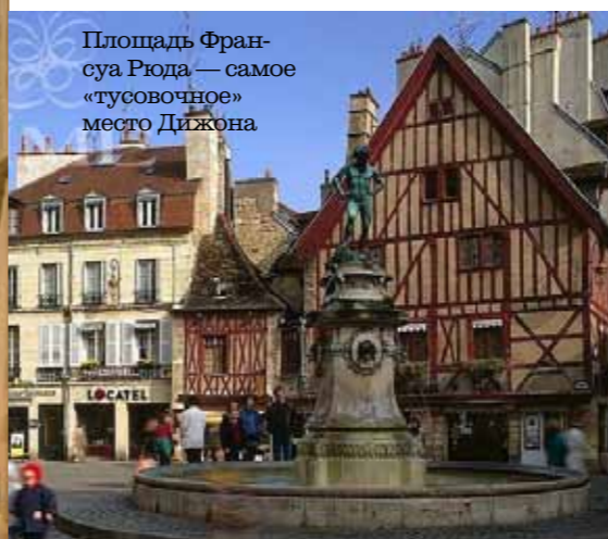
Площадь Франсуа Рюда — самое «тусовочное» место Дижона

Выбирая гостинцы для друзей и близких, непременно изучите пестрый ассортимент магазина Athenaeum и бутик уважаемой винодельческой компании Maison Drouhin ( www.drouhin.com ).