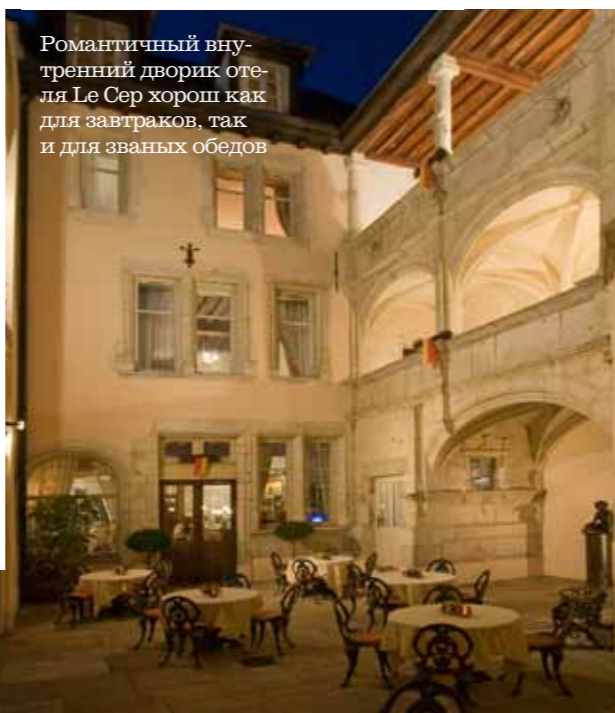
Романтичный внутренний дворик отеля Le Cep хорош как для завтраков, так и для званных обедов

В Боне немало приятных ресторанов, идеальных для знакомства с бургундской кухней, среди хитов которой виноградные улитки (эскарго) во всех вариациях, бёфбургиньон, кок-о-вэн (петух, тушеный в вине), жареные голуби, а на десерт — уникальный ассортимент французских сыроварен.