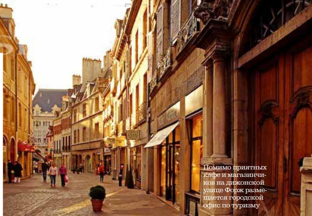
Помимо приятных кафе и магазинчиков на дижонской улице Форж размещается городской офис по туризму