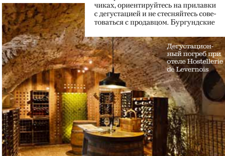
Дегустационный погреб при отеле Hostellerie de Lervenois